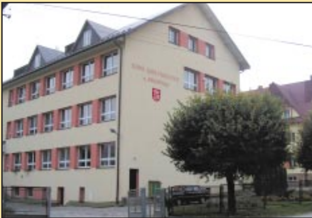
Budynek Gimnazjum w Jodłowniku po remoncie