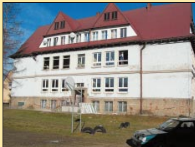
Budynek Szkoły Podstawowej w Jodłowniku przed remontem