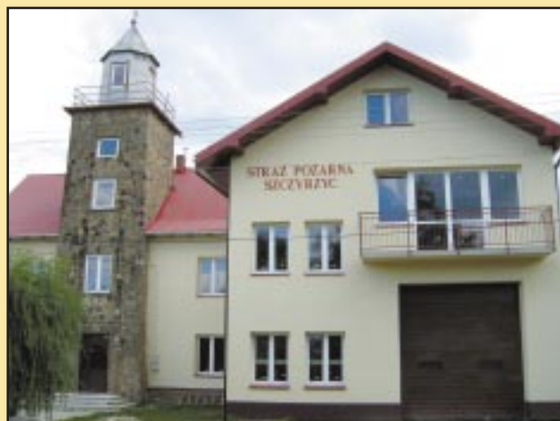
Budynek OSP Szczyrzyc po remoncie wraz z dobudowanym garażem