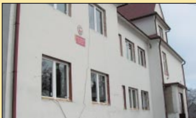
Budynek Szkoły Podstawowej w Krasnem-Lasocicach przed remontem