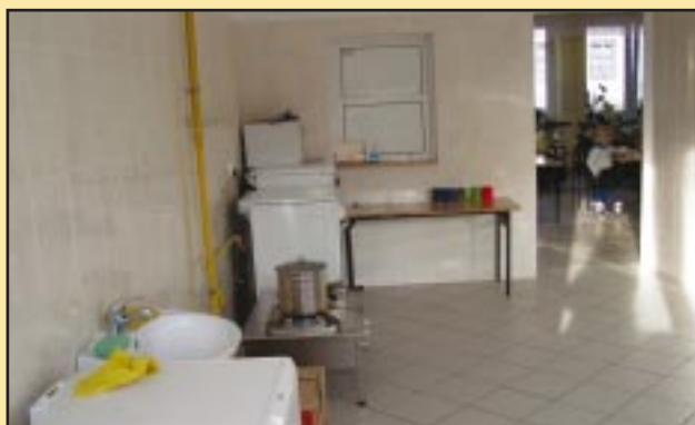
Nowa kuchnia w Szkole Podstawowej w Szyku