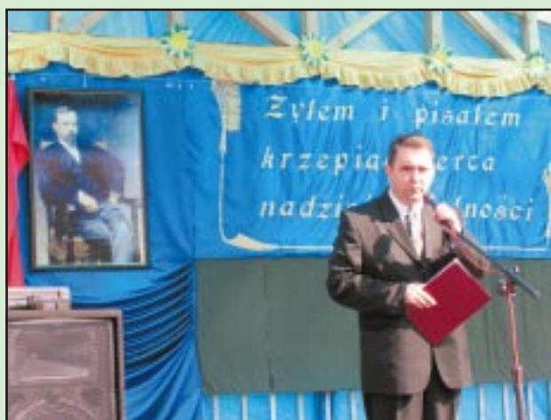
Uroczystość z okazji nadania Szkole imienia Henryka Sienkiewicza oraz sztandaru Szkole Podstawowej w Szyku - 3 maja 2006