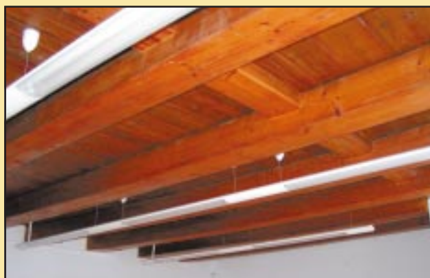
Nowe oświetlenie sal lekcyjnych w Gimnazjum w Szczyrzycu