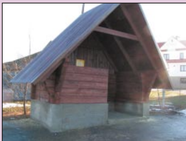
Nowy przystanek w Krasnem-Lasocicach