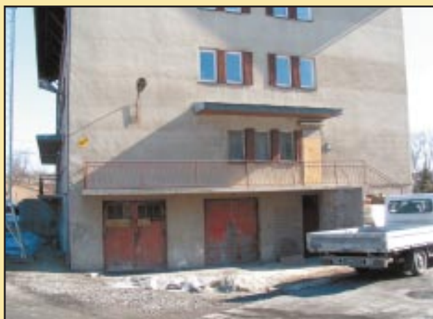
Budynek Urzędu Gminy przed remontem