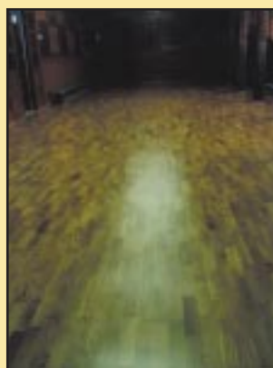
Nowa posadzka w Gimnazjum Szczyrzycu