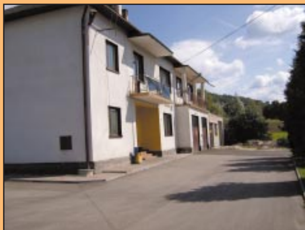
Zaasfaltowany plac przy remizie w Wilkowisku