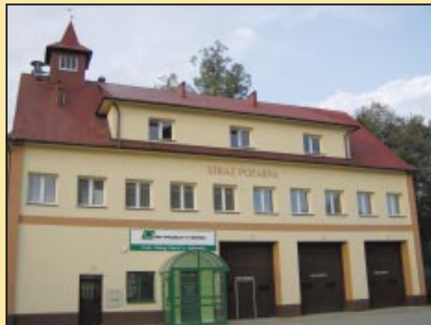
Budynek OSP Jodłownik po remoncie