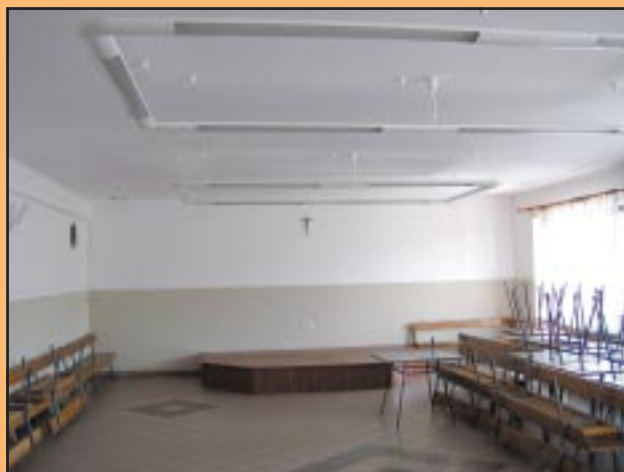
Odnowiona świetlica w OSP Wilkowisko