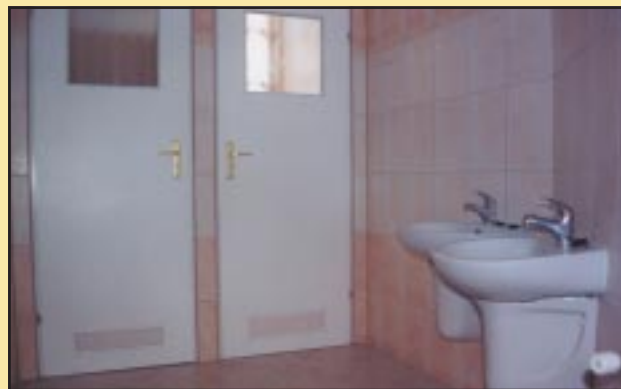
Szalety po remoncie w Gimnazjum w Szczyrzycu