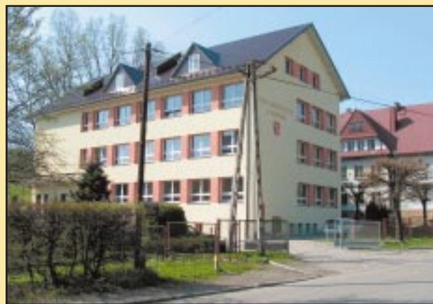
Nowy dach na Gimnazjum w Jodłowniku