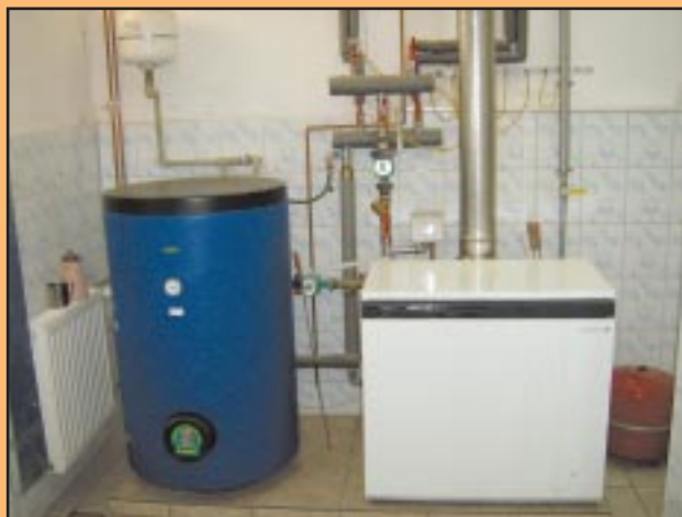
Nowa kotłownia OSP Pogorzany