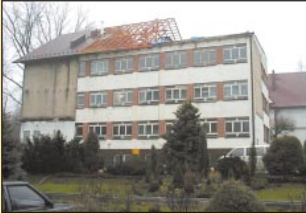
Budynek Gimnazjum w Jodłowniku przed remontem