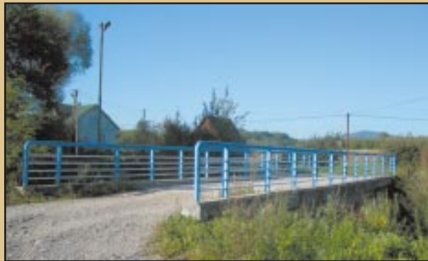
Nowy most w Mstowie