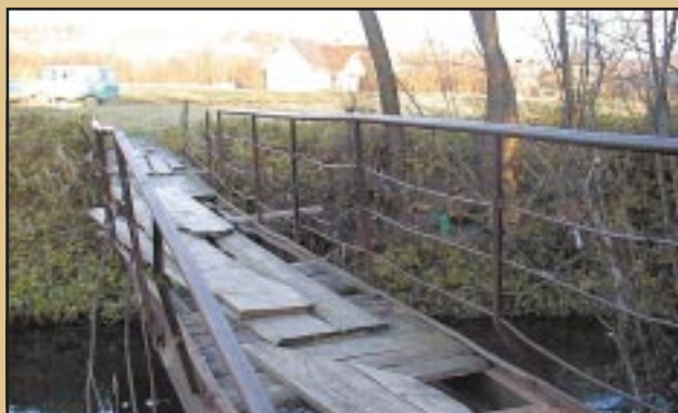
Stara kładka w Mstowie