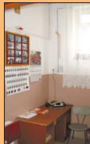
OSP Sadek odnowiona dyżurka