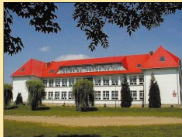
Budynek Zespołu Szkół w Wilkowisku przed remontem