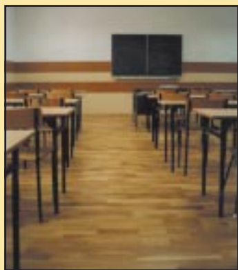
Odnowiona sala w Gimnazjum Szczyrzycu