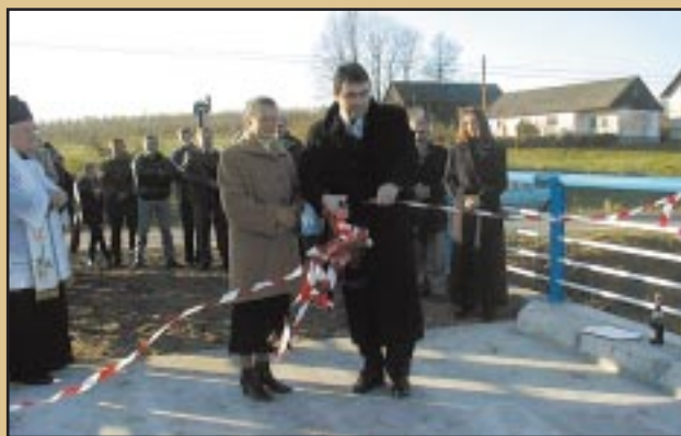
Otwarcie nowego mostu w Mstowie