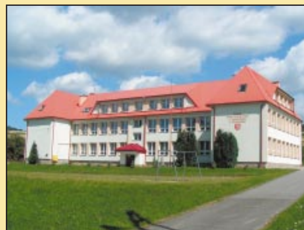
Budynek Zespołu Szkół w Wilkowisku po remoncie