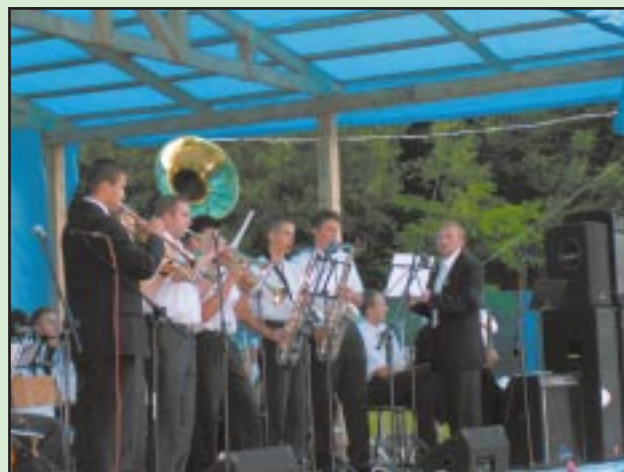
20 lat Orkiestry Parafialnej w Jodłowniku - 2 lipca 2006