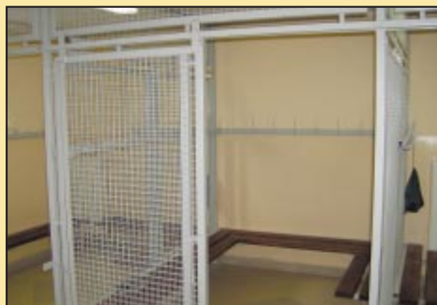
Adaptacja pomieszczeń starej kotłowni na szatnie w Szkole Podstawowej w Jodłowniku