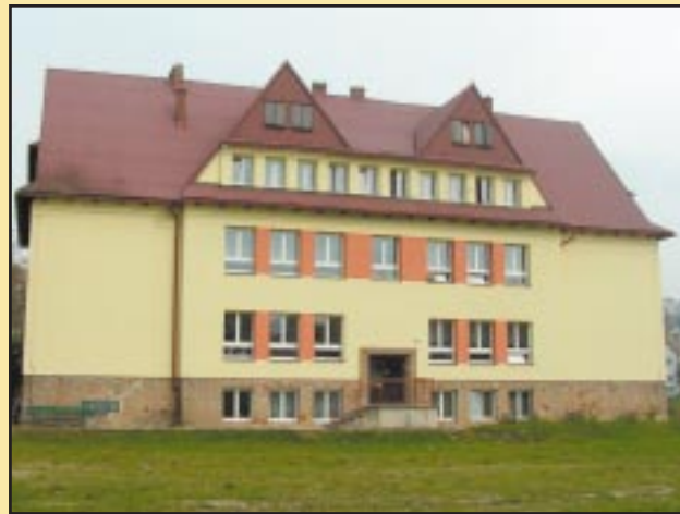
Budynek Szkoły Podstawowej w Jodłowniku po remoncie