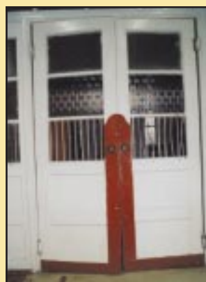
Stare drzwi w Gimnazjum Szczyrzycu