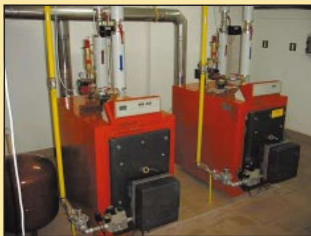
Nowa kotłownia w Szkole Podstawowej w Szczyrzycu