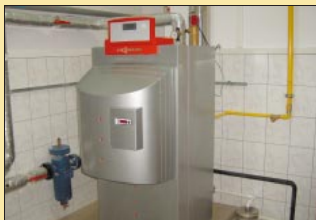
Nowy piec CO w budynku Urzędu Gminy Jodłownik