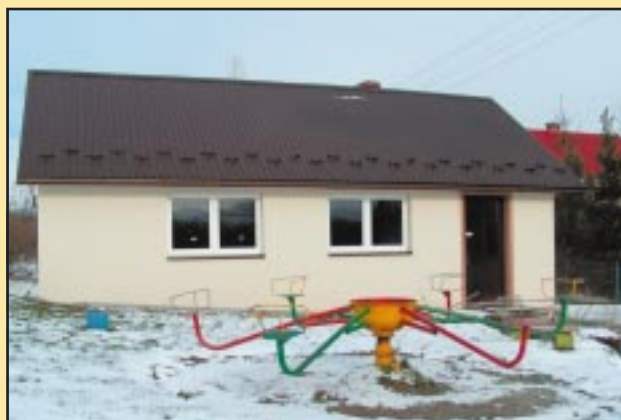
Budynek gospodarczy przebudowany na świetlicę