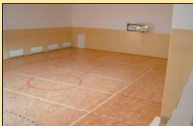
Sala gimnastyczna w Szczyrzycu