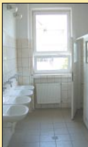
Odnowiony sanitariat w Gimnazjum w Jodłowniku