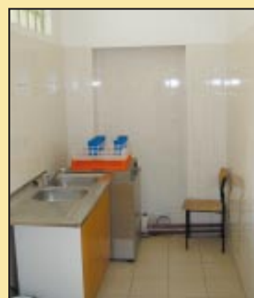
Odnowiona kuchnia (zmywalnia) w Zespole Szkół w Wilkowisku