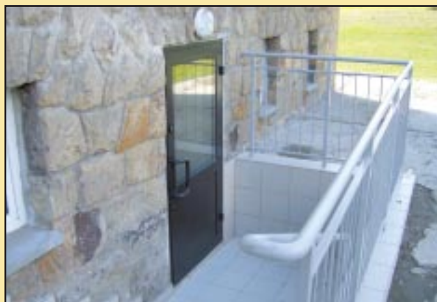
Wejście do szatni i przyziemia w Szkole Podstawowej w Jodłowniku