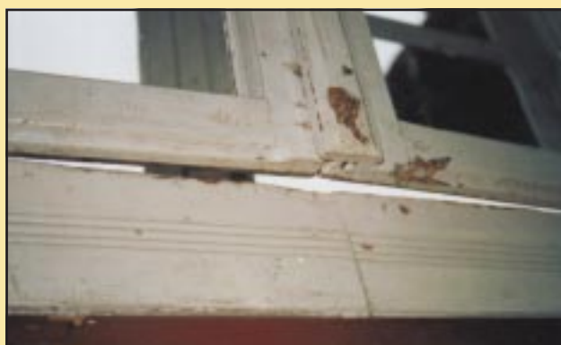
Stara stolarka okienna w Gimnazjum w Szczyrzycu