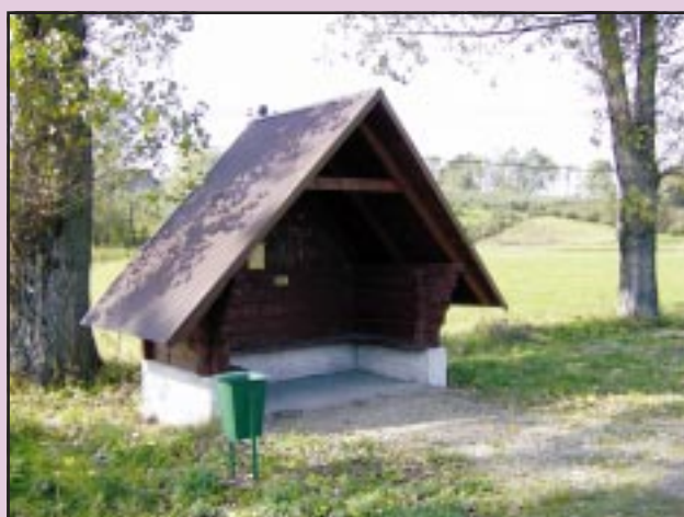
Nowy przystanek w Jodłowniku