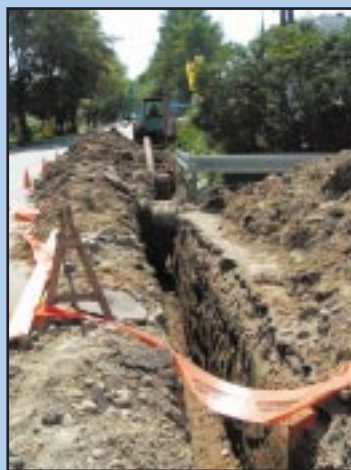
Budowa wodociągu i kanalizacji

Równolegle, prowadzone są działania związane z Gospodarką ściekową, a popularnie mówiąc kanalizacją sanitarną w naszej gminie. Powstała koncepcja techniczna Gospodarki Ściekowej dla całego obszaru Gminy Jodłownik przewidująca na naszym obszarze trzy Oczyszczalnie Ścieków w dorzeczu Stradomki Oczyszczalnia Szczyrzyc, w dorzeczu Tarnawy Oczyszczalnia Jodłownik i Słupia. Dlatego aby obniżyć koszty przedsięwzięć tam gdzie będzie to możliwe zostaną zaprojektowane rozwiązania polegające na prowadzeniu wody i kanalizacji w jednym wykopie.