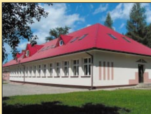
Budynek Szkoły Podstawowej w Szyku po remoncie