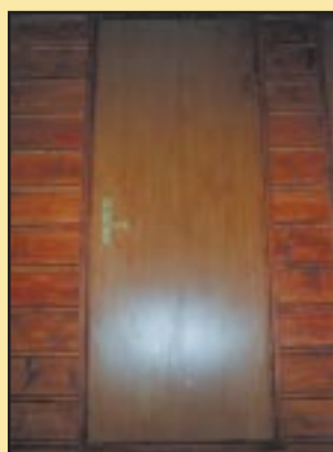
Nowe drzwi w Gimnazjum Szczyrzycu