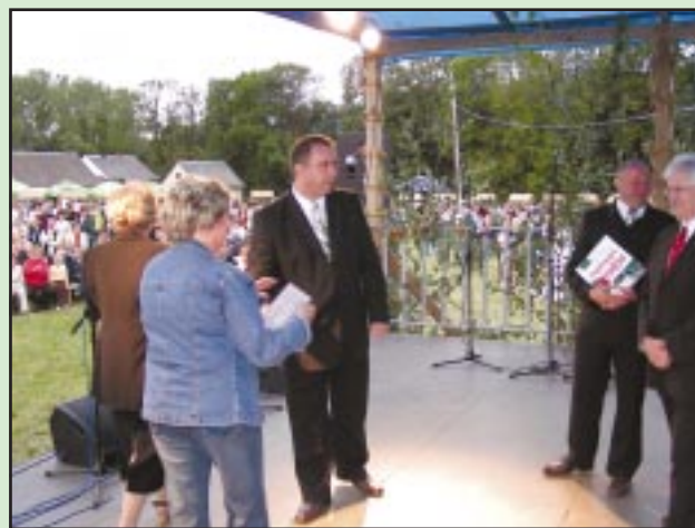
Owocobranie 15 sierpnia 2006