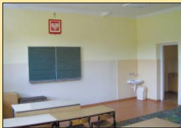
Odnowiona klasa w Szkole Podstawowej w Jodłowniku