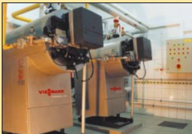
Nowa kotłownia w Zespole Szkół w Jodłowniku