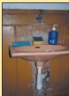
Umywalka przed remontem w Gimnazjum Szczyrzycu