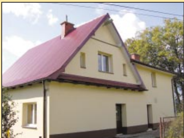
Budynek szkoły w Słupi po remoncie