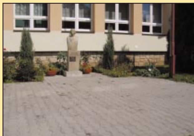
Chodnik obok Zespołu Szkół w Wilkowisku