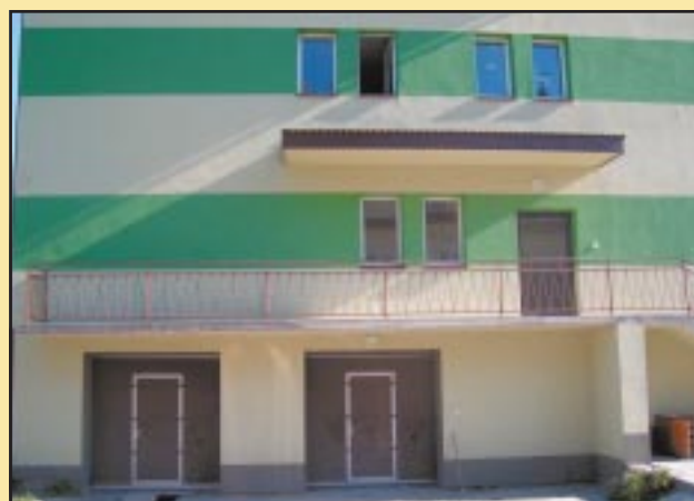
Budynek Urzędu Gminy po remoncie