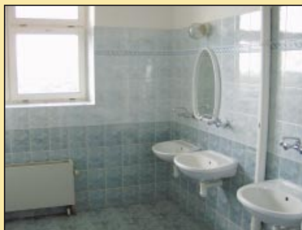
Sanitariat w szkole w Sadku-Kostrzu

Podsumowując inwestycje związane z budynkami użyteczności publicznej na terenie Gminy Jodłownik w latach 2001-2006 czyli trzy etapy termomodernizacji, których koszt wyniósł 3 925 792,87 zł w tym środków poza budżetowe 2 099 132 zł (dotacja bezzwrotna) oraz środków budżetu gminy w kwocie 1 831 660, 69 zł można stwierdzić, że każda „złotówka” wydawana z budżetu gminy przynosi 100% środków pozyskanych z zewnątrz.