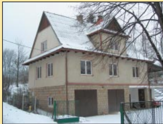
Budynek OSP Pogorzany przed remontem