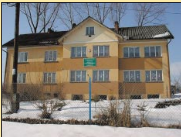
Budynek szkoły w Mstowie przed remontem