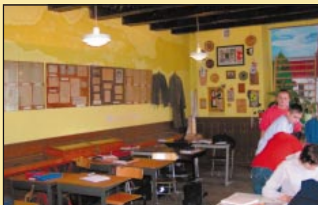
Stare oświetlenie sal lekcyjnych w Gimnazjum w Szczyrzycu