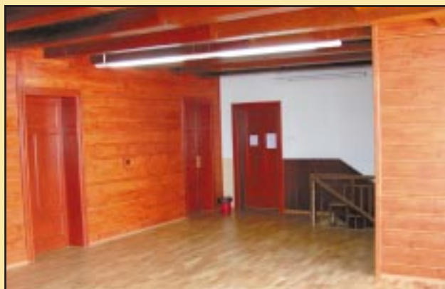
Odnowiony korytarz i posadzka w Gimnazjum w Szczyrzycu