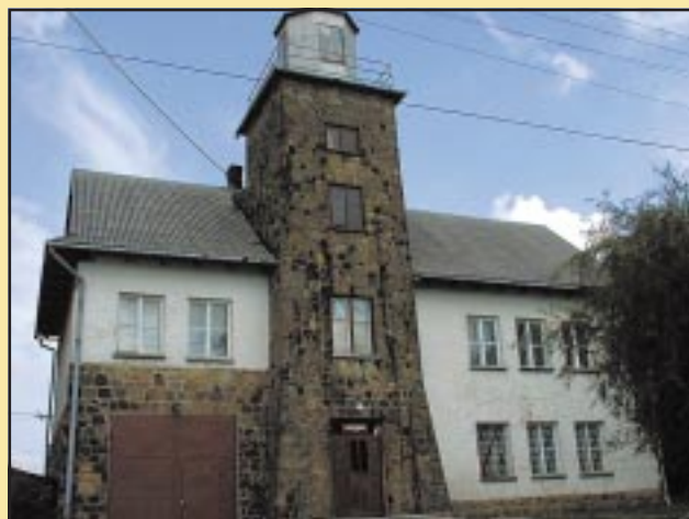
Budynek OSP Szczyrzyc przed remontem