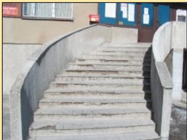
Stare schody w Urzędzie Gminy Jodłownik