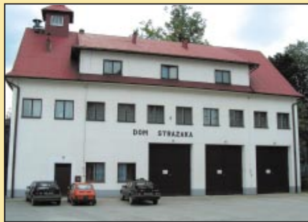
Budynek OSP Jodłownik przed remontem