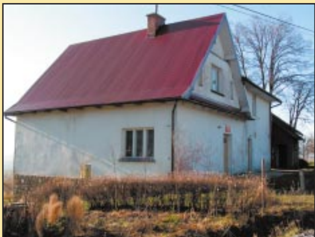
Budynek szkoły w Słupi przed remontem