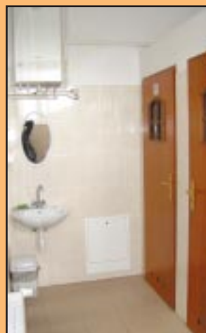
Sanitariat OSP Sadek