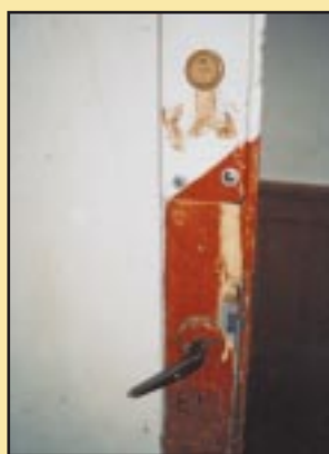
Stare drzwi w Gimnazjum Szczyrzycu