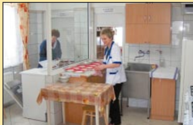
Kuchnia po remoncie w przedszkolu w Jodłowniku