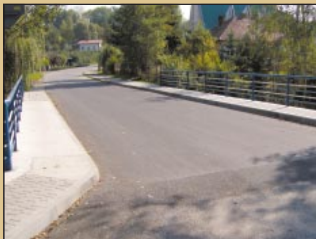
Most centrum Jodłownika po remoncie

Ogółem koszt modernizacji dróg i mostów w 2006 roku wyniósł 450 186,71 zł: