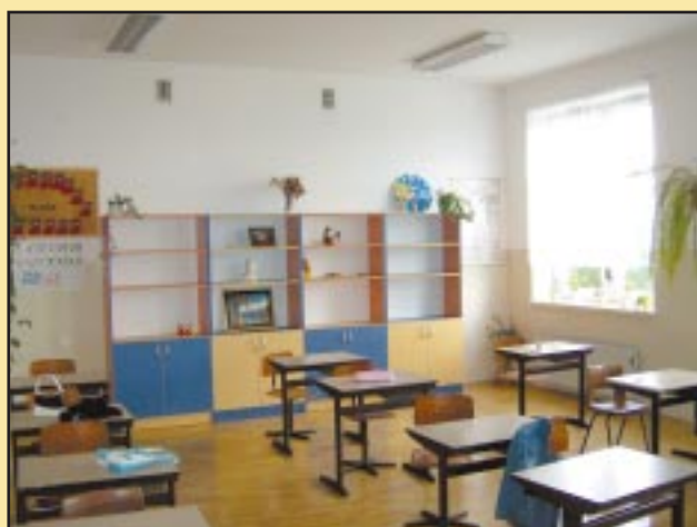
Sala lekcyjna w szkole w Sadku-Kostrzu