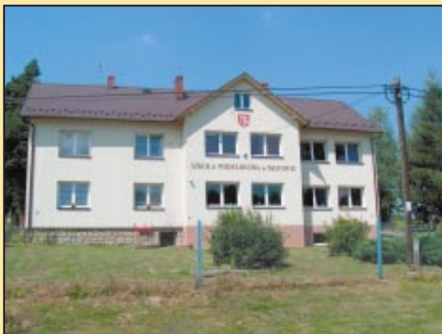
Budynek szkoły w Mstowie po remoncie