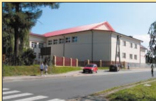
Budynek sali gimnastycznej w Szczyrzycu