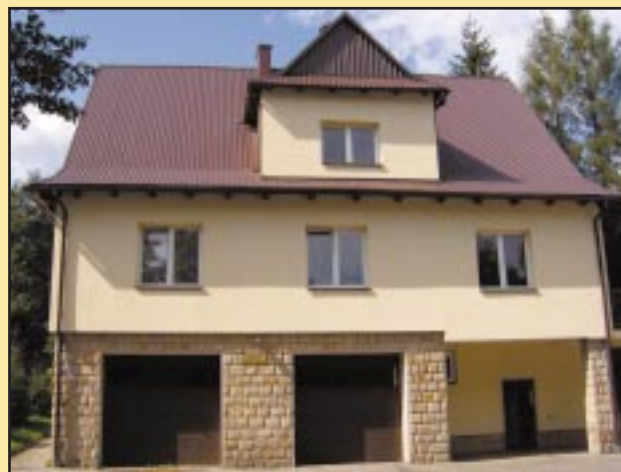
Budynek OSP Pogorzany po remoncie