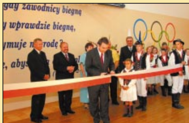
Otwarcie sali gimnastycznej w Szczyrzycu