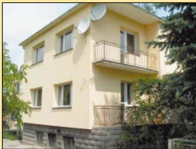
Ośrodek Zdrowia w Szczyrzycu po remoncie