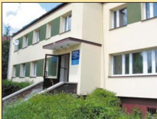
Ośrodek Zdrowia w Jodłowniku po remoncie