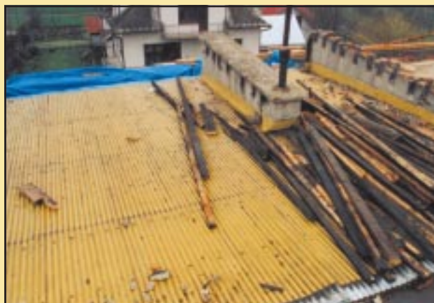
Stary dach na Gimnazjum w Jodłowniku