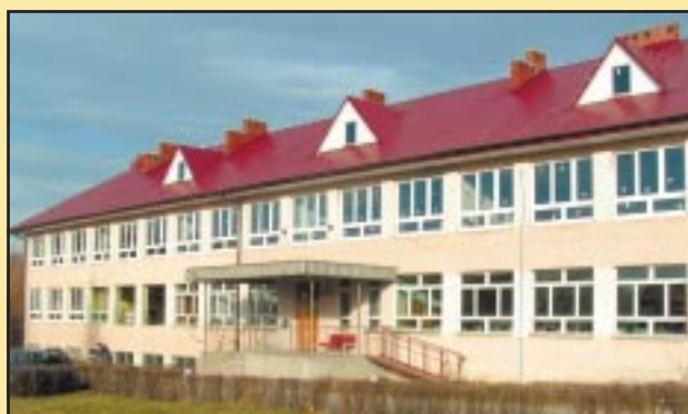
Budynek Szkoły Podstawowej w Szczyrzycu przed remontem