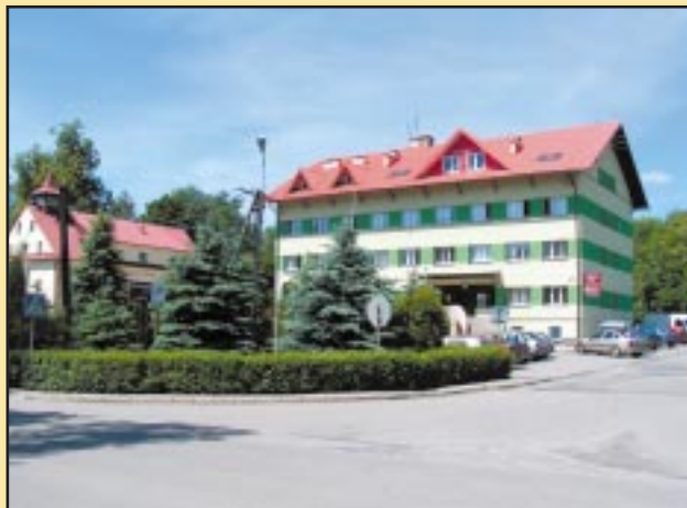
Budynek Urzędu Gminy po remoncie