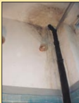
Przemakający strop w Gimnazjum w Jodłowniku