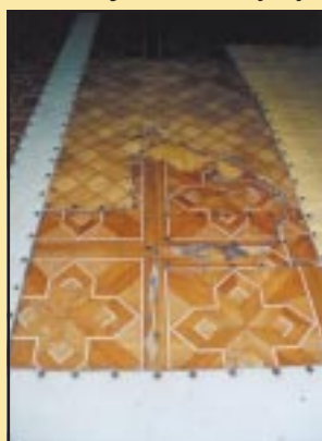
Stara posadzka w Gimnazjum Szczyrzycu