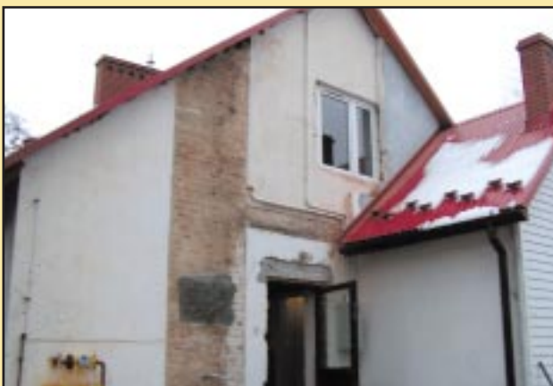
Budynek Przedszkola w Jodłowniku przed remontem