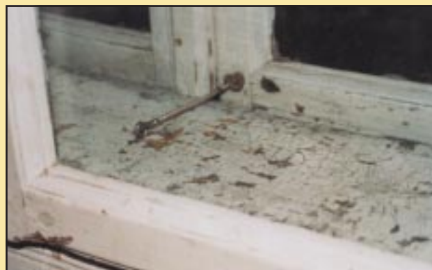
Stara stolarka okienna w Gimnazjum w Szczyrzycu