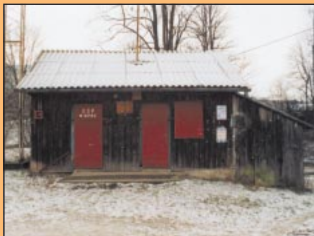
Stara remiza w Szyku