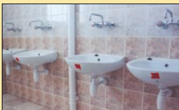
Łazienka po remoncie w Szkole Podstawowej w Szyku