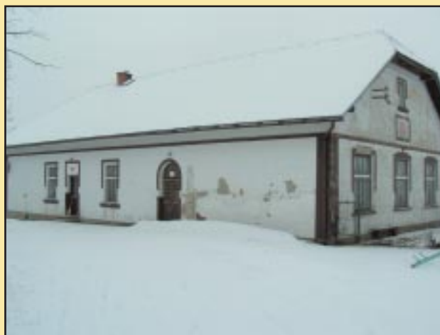
Budynek szkoły w Górze Świętego Jana przed remontem