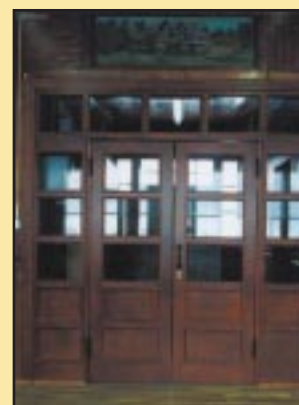
Nowe drzwi w Gimnazjum Szczyrzycu