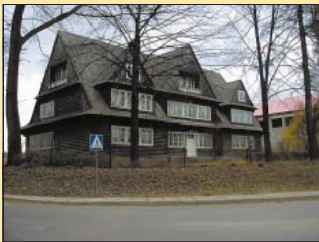
Budynek Gimnazjum w Szczyrzycu przed remontem