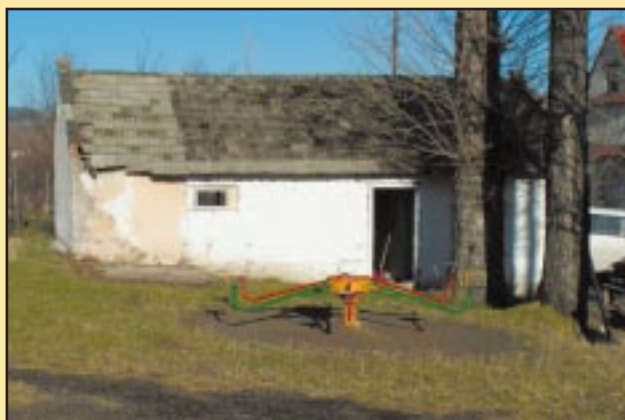
Stary budynek gospodarczy w Mstowie