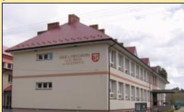
Budynek Szkoły Podstawowej w Szczyrzycu po remoncie