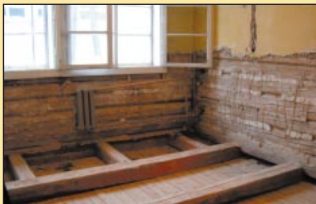
Wymiana posadzek w Gimnazjum w Szczyrzycu