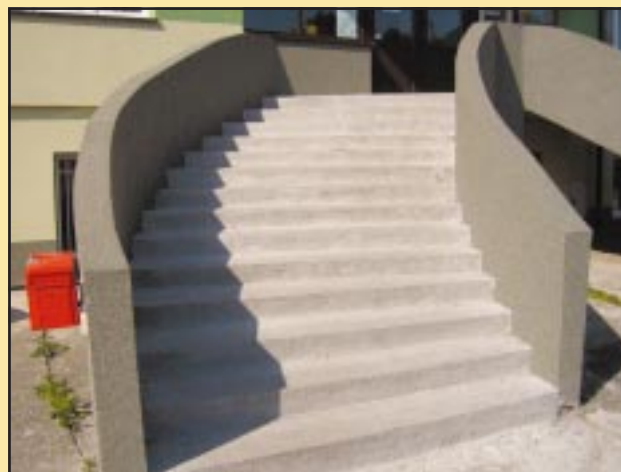
Odnowione schody w Urzędzie Gminy Jodłownik