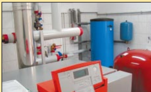
Nowa kotłownia w Szkole Podstawowej w Szyku