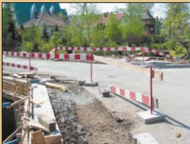
Most centrum w Jodłownika w trakcie remontu