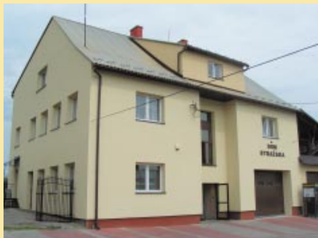
Budynek OSP Krasne-Lasocice po remoncie

W trzecim etapie koszt termomodernizacji wyniósł 1 130 332 zł