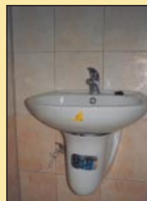
Umywalka po remoncie w Gimnazjum Szczyrzycu