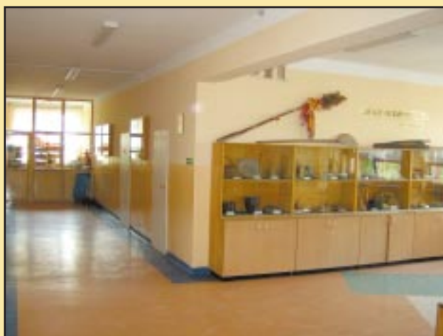
Odnowiony korytarz i posadzka w Gimnazjum w Jodłowniku