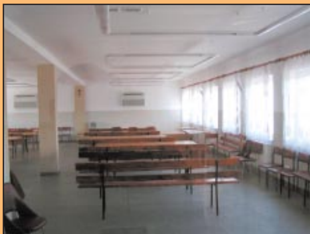
Odnowiona świetlica w OSP Jodłownik