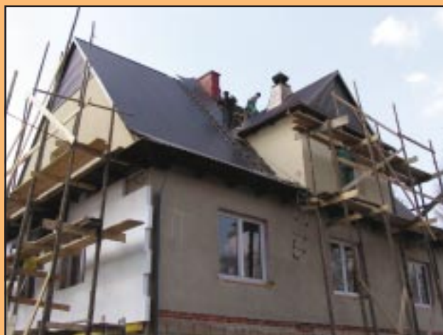
Wymiana dachu i ocieplenie budynku OSP Pogorzany

Ponadto, w 2006 roku Wójt Gminy pozyskał środki z Komendy Głównej PSP w Warszawie dla jednostek OSP: