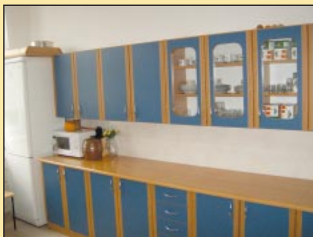
Kuchnia w szkole w Sadku-Kostrzu