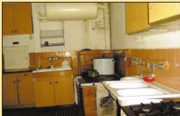
Kuchnia przed remontem w przedszkolu w Jodłowniku