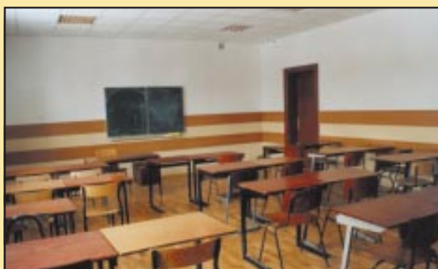
Odnowiona sala w Gimnazjum Szczyrzycu