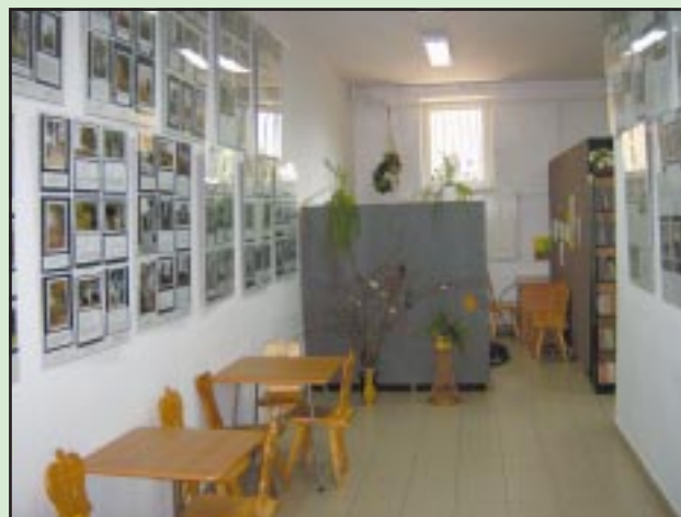
Biblioteka w Jodłowniku