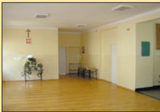
Odnowiony korytarz w Szkole Podstawowej w Jodłowniku