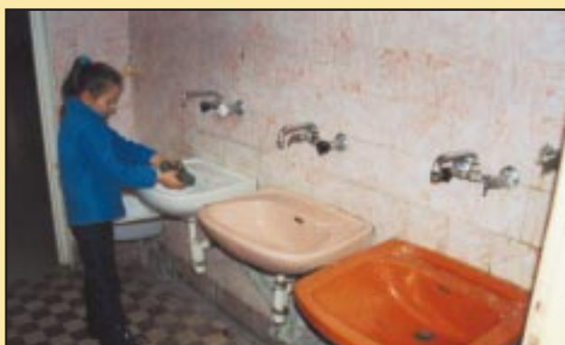
Łazienka przed remontem w Szkole Podstawowej w Szyku