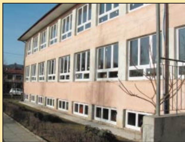
Nowe okna w Szkole Podstawowej w Szczyrzycu