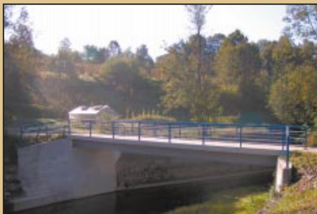
Most Opoka -Rusin

Koszt inwestycji: 107 919.67 zł Pozyskane źródła finansowania: Dotacja z KPRM: 86 335 zł Środki własne 21 584.67 zł