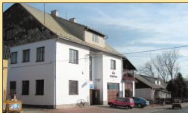
Budynek OSP Krasne-Lasocice przed remontem