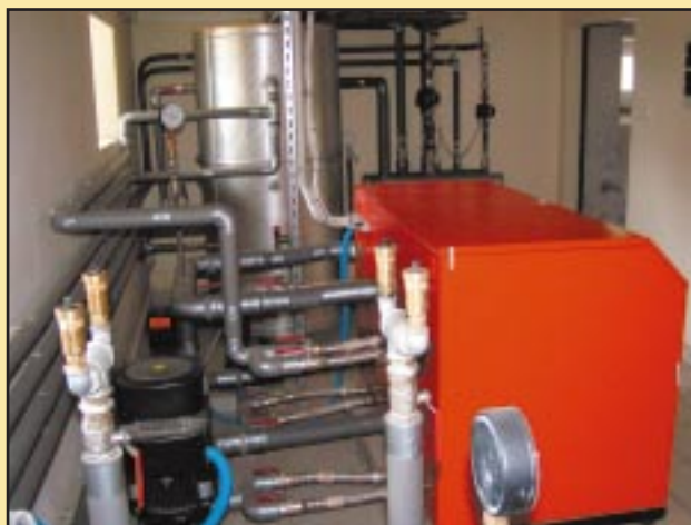
Pompa ciepła w Szkole Podstawowej w Krasnem-Lasocicach