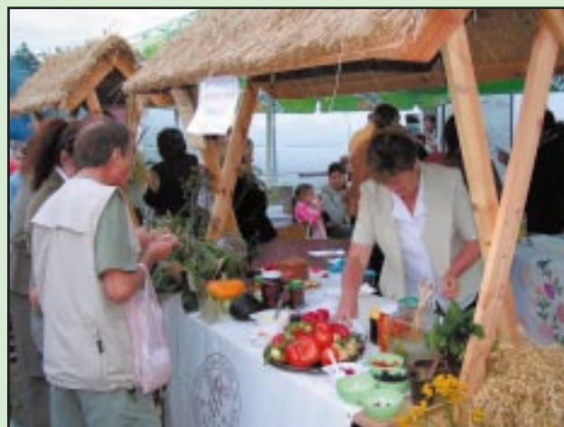
Owocobranie 15 sierpnia 2006