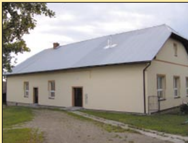
Budynek szkoły w Górze Świętego Jana po remoncie