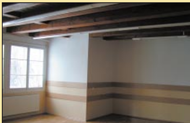
Sala po remoncie w Gimnazjum w Szczyrzycu