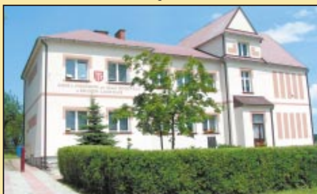
Budynek Szkoły Podstawowej w Krasnem-Lasocicach po remoncie