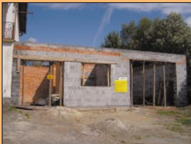
Dobudowa garażu w OSP Wilkowisko