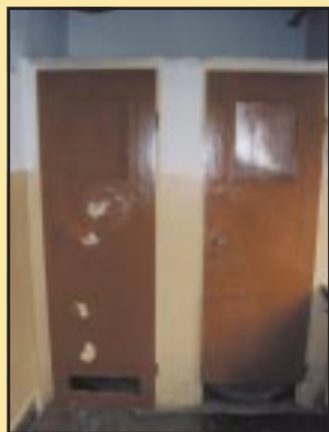
Szalety przed remontem w Gimnazjum w Szczyrzycu