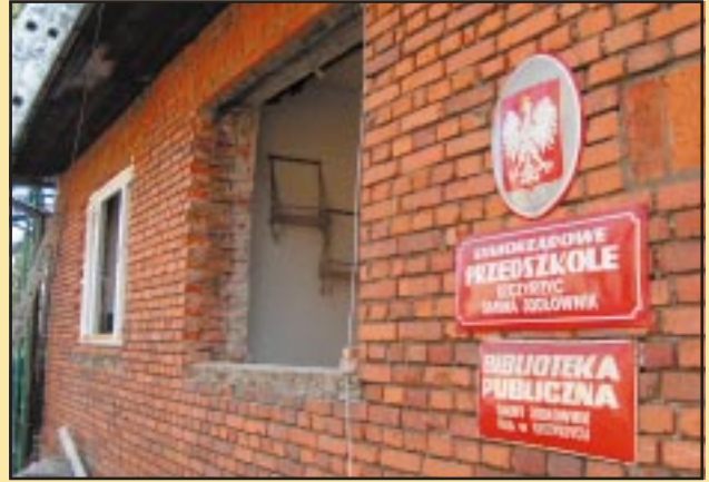
Budynek Przedszkola w Szczyrzycu przed remontem