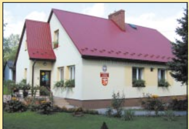
Budynek Przedszkola w Jodłowniku po remoncie