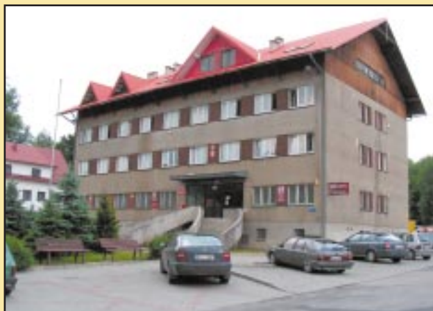
Budynek Urzędu Gminy przed remontem