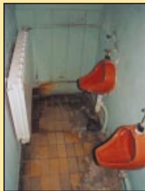
Stare pisuary w Gimnazjum w Szczyrzycu