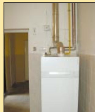
Nowy piec C.O. w szkole w Górze Świętego Jana