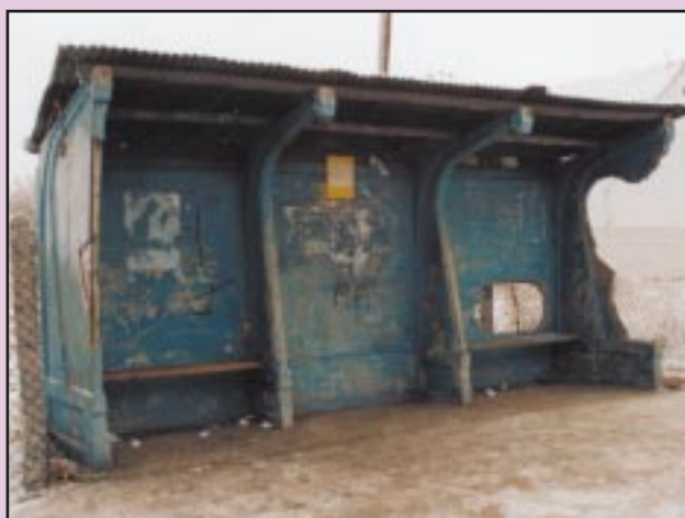
Stary przystanek w Krasnem-Lasocicach