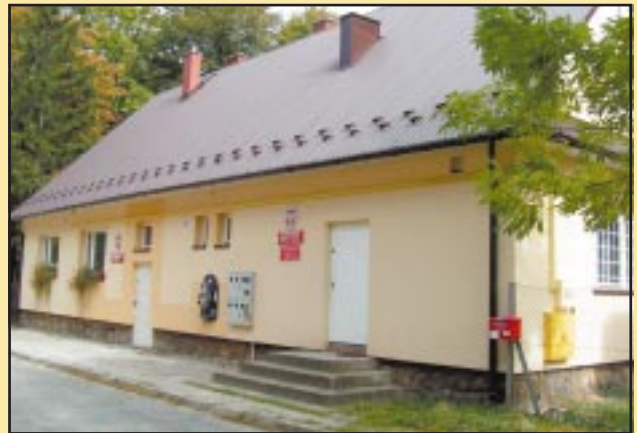
Budynek Przedszkola w Szczyrzycu po remoncie