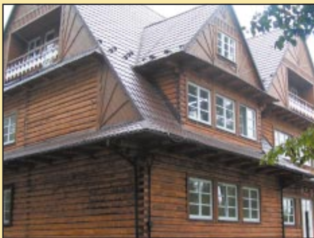
Budynek Gimnazjum w Szczyrzycu po remoncie

W drugim etapie koszt termomodernizacji wyniósł 1 216 287 zł