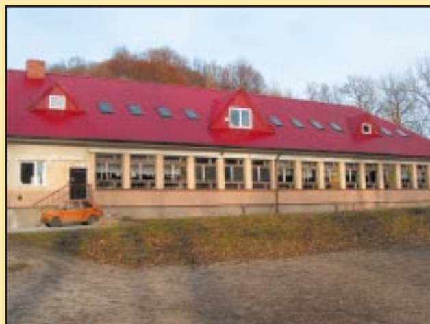
Budynek Szkoły Podstawowej w Szyku przed remontem