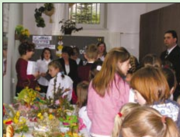
Gminny konkurs plastyczny „Stroiki Wielkanocne”