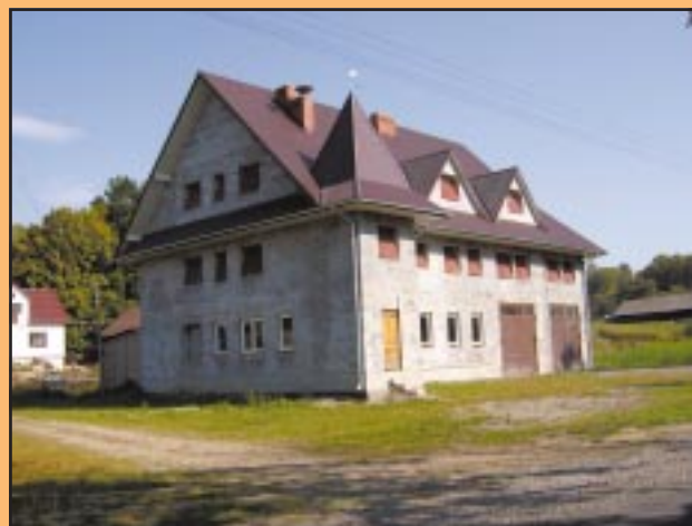
Nowa remiza w Szyku