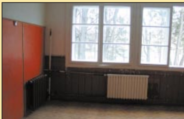
Sala przed remontem w Gimnazjum w Szczyrzycu