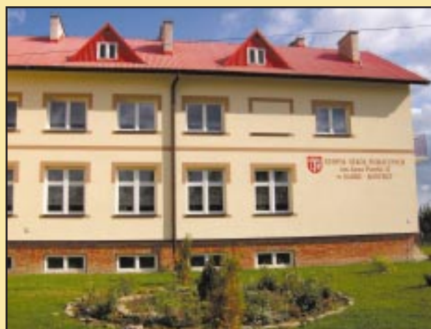
Szkoła w Sadku-Kostrzy