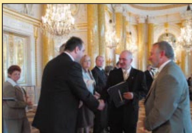
Wręczenie Wójtowi Gminy Jodłownik wyróżnienia w Ogólnopolskim Konkursie „Modernizacja roku 2005”

Oprócz zadań związanych z termomodernizacją w latach 2001 - 2006, zostały wykonane prace związane z wymianą pokryć dachowych oraz z remontami wnętrz tychże obiektów.